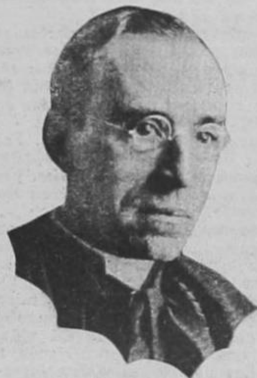
SU SANTIDAD PIO XII

EN UNA APELACION A LA PAZ DIRIGIDA AL MUNDO ENTERO, EL SUMO PONTIFICE CALIFICA LA ACCION SOVIETICA DE AGRESION PREMEDITADA CONTRA UNA PEQUEÑA NACION AMANTE A LA PAZ Y AL TRABAJO